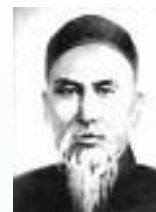
Yang Shao Hou