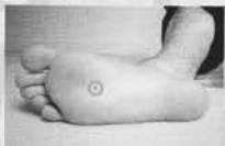
Sous les pieds : le point Yongquan.