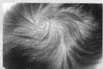
Au sommet de la tête : le point Bahui.

Portez votre attention sur le flux Yin (flèches bleues), Tai Yin sur l'intérieur. Jue Yin au milieu. Chao Yin en profondeur et à l'extérieur. Ensuite, portez votre attention sur le flux Yang (flèches rouges). Yang Ming sur l'intérieur et en connexion avec le Yin sur la partie avant du corps. Chao Yang sur le milieu et les cotés. Tai Yang à l'extérieur et sur toute la partie arrière du corps. Les bras et la poitrine forment une coupe qui accueille le ciel. Les jambes et le petit bassin forment une coupe inversée qui accueille la terre. Rendez le Cœur et l'esprit vides et innocents.